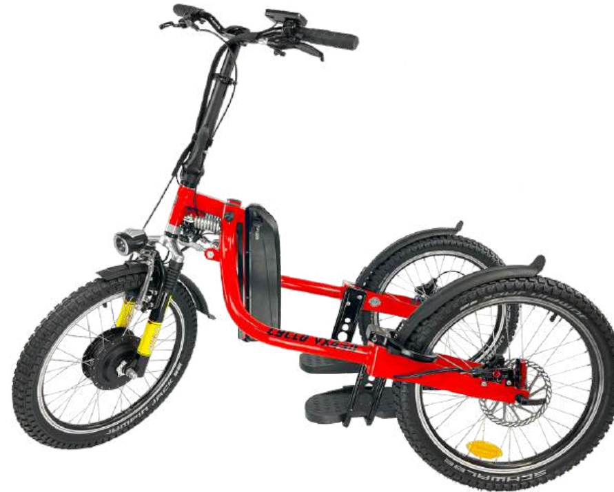
CYCLO VX - 90 NM