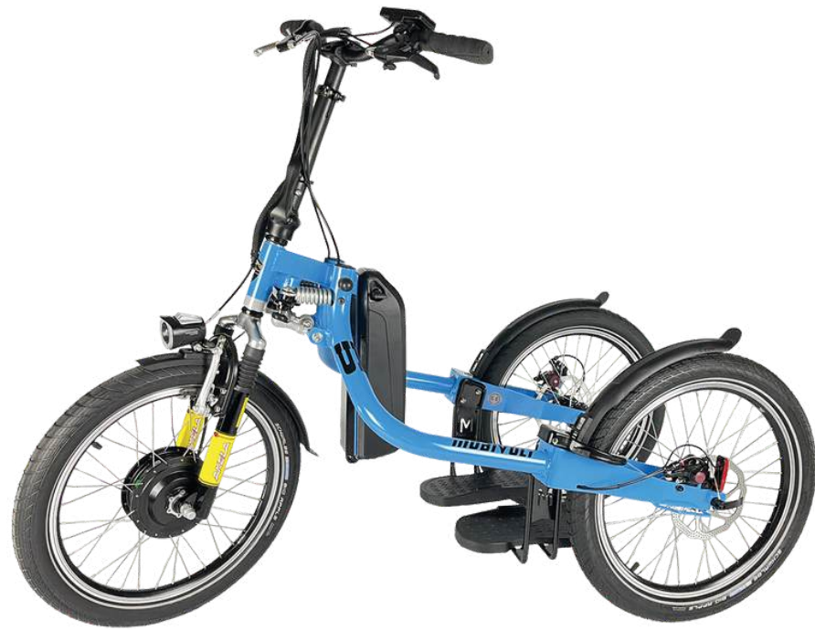
CYCLO VR - 45 NM